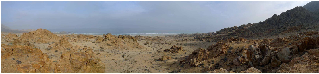
Nationalpark Pan de Azucar

Reiseroute: Toconao, Antofagasta, Chañaral, Caldera, Copiapo, La Serena, Vicuña