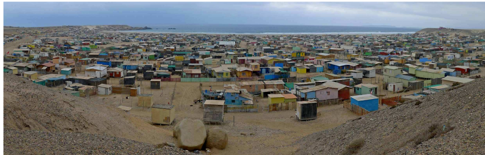
Puerto Viejo – verlassenes Feriendorf