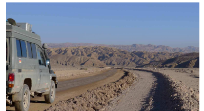
Nationalpark Pan de Azucar