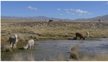
Alpakas im Eiswasser