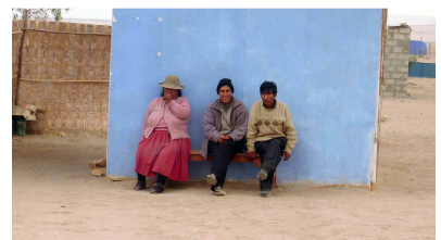
... unsere „Gastgeber“