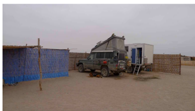
letzte Übernachtung in Peru...