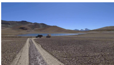
Mittagsrast auf über 4400 m