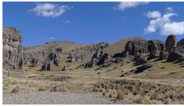
Tal des Rio Huenque