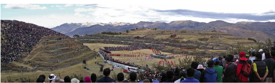
Inti Raymi Fest