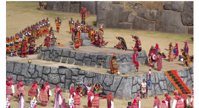
Inti Raymi Fest