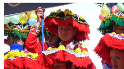
Konzentration vor dem Auftritt