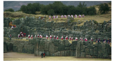
Inti Raymi Fest