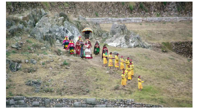
Inti Raymi Fest