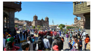
Plaza von Cusco