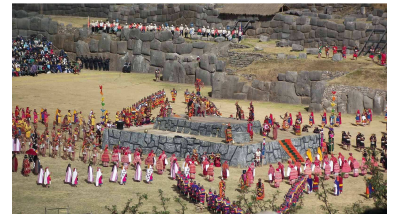
Inti Raymi Fest