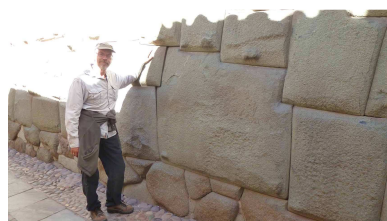
der berühmte 12-eckige Stein