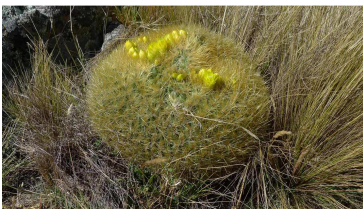
Kakteen gibt es auch hier oben