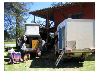
Camping auf der Hacienda