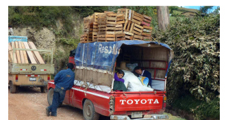
Warten ist ermüdend.