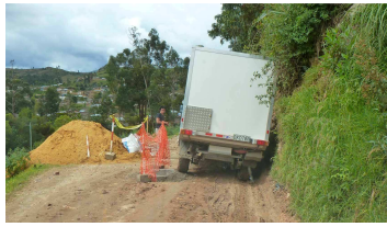
immer wieder Baustellen