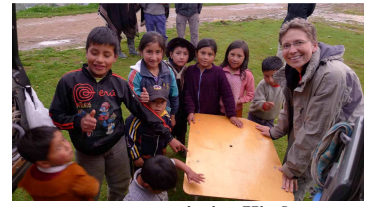
nette, neugierige Kinder