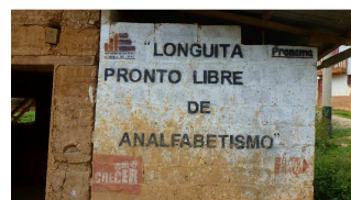
Kampf dem Analphabetismus