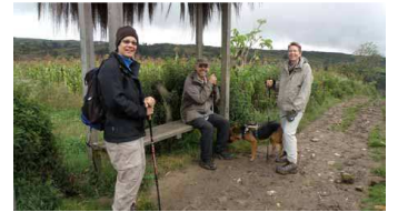
am Weg zu den Statuen