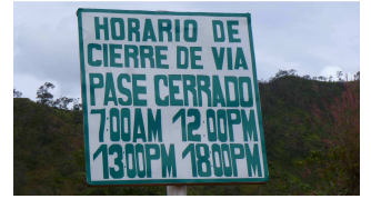
Nur eine Stunde ist die Piste geöffnet!