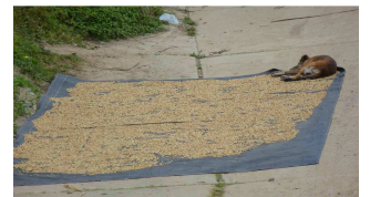
Schläfchen auf Kaffeebohnen