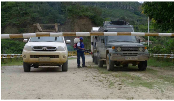
Desinfektion vor dem peruanischen Schlagbaum