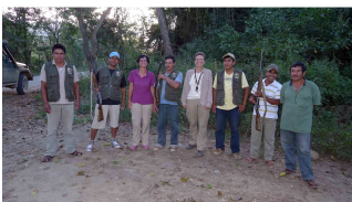
Die Polizei, dein Freund und Helfer!