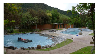
Termen von Patallata