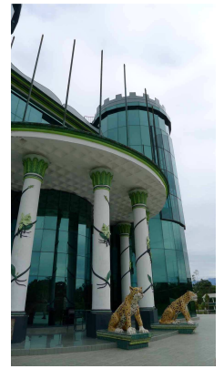
Uni in Tena

Reiseroute: Tena, Amazonas-Gebiet, Termas de Papallata