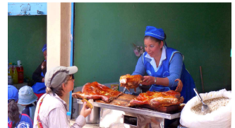
eine Handvoll Spansau