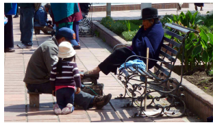
Schuhputz vor dem Marktbesuch