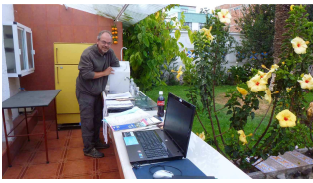
Hostal Oasis II Freiluftarbeitsplatz