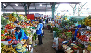
Frucht- und Gemüseträume