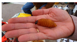
Larve eines Hirschkäfers - soll gegrillt heilende Wirkung haben