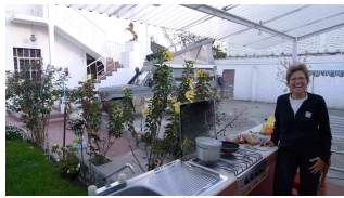
Outdoor-cooking mit Küchenzeile