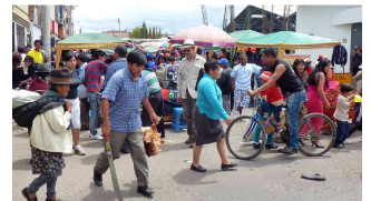
das arme Hühnchen