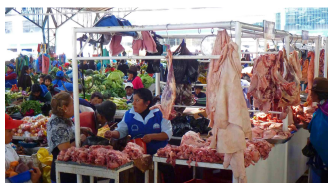
Fleisch zum Abgewöhnen