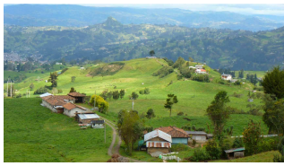
Gegend um Ingapirca