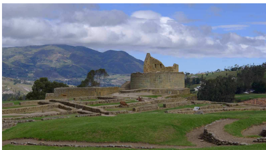
Blick auf den Sonnentempel