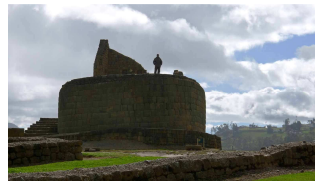
Sonnentempel, zw. 1450 und 1480 von den Inkas erbaut