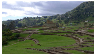
erster Blick auf die Inkaruine