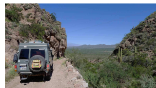
eng geht es zu