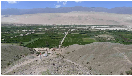
Blick auf die Dünen von Medanitos