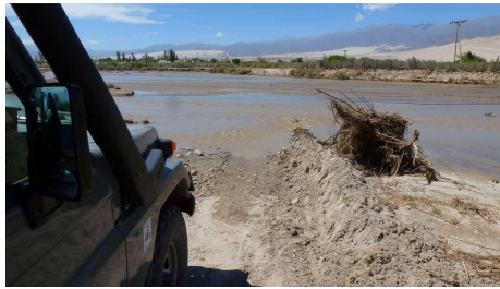
Ende unserer Dakar-Etappe