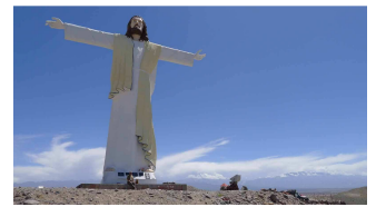
Christusstatue bei Medanitos