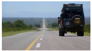
on the road again