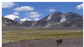
Ojos de Salado (6879 m)