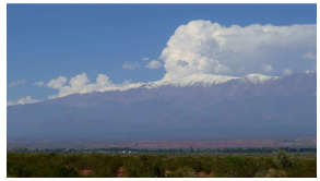
Sierra de Famatina (5000 m zwischen Tal und Gipfel)