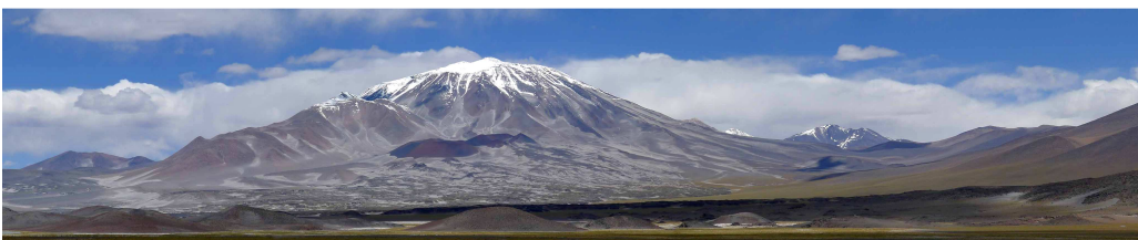
Vulkan Incahuasi (6638 m)