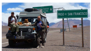
Passhöhe 4726 m