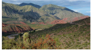
Cuesta de Miranda