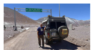
Passhöhe 4752 m