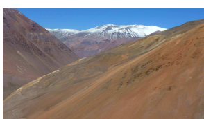
Abfahrt nach Argentinien