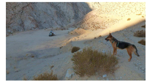
Übernachtung auf 1800 m

Reiseroute: Paso Agua Negra, San Jose de Jachal