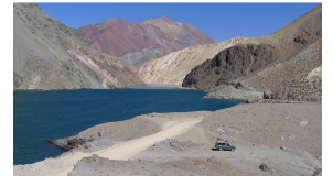
Laguna auf 3180 m