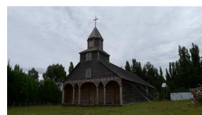
Kirche in Ichuac