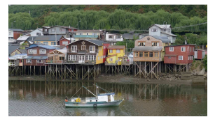
Palafitos in Castro