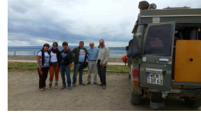
Egal wo wir auch stehen, die Chilenen interessieren sich für unser Auto und uns. Anders als in vielen Reiseberichten beschrieben, erleben wir sie sehr kontaktfreudig.