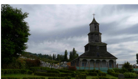
Kirche in Nercon