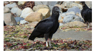
Ist er nicht süß?