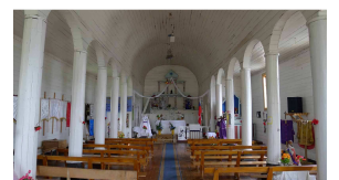
Kirche in Detif