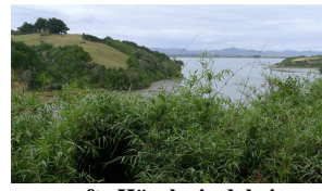
sanfte Hügel wie daheim