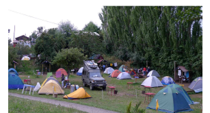
eingepfercht zwischen Rucksacktouristen