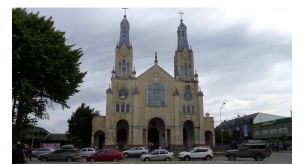
Kathedrale in Castro