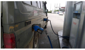
Mulle hat Durst