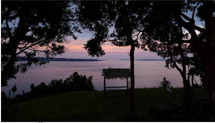
Übernachtung mit Orca-Blick