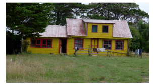
typisches zweifarbiges Landhaus