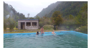
Termas el Amarillo