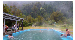
Termas el Amarillo