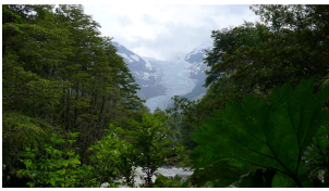
Gletscher Yelcho Chico