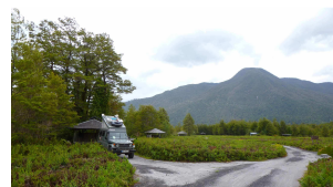
im Parque Pumalin