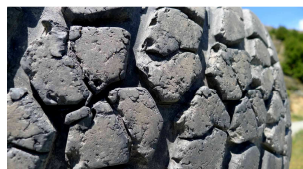
... für Mensch und Material.