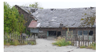
verlassenes Haus in Chaiten