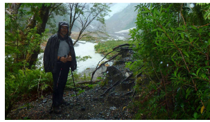
am Ende des Weges ...