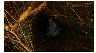
... aber guter Laune

Reiseroute: Carretera Austral, Termas el Amarillo, Chaiten, Caleta Gonzalo