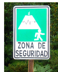
wenn´s hilft !?