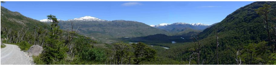
Regenwald und Gletscher