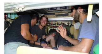
die drei „Jungs“ im Mulle