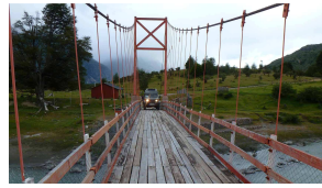
schmal und schwingend