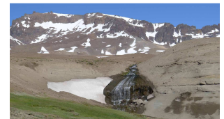
Schneesmelze - es wird Sommer