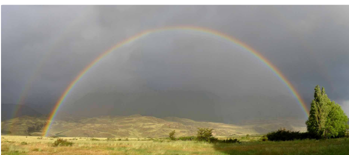
unsere Begrüßung in Chile