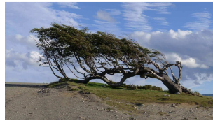
und immer bläst der Wind