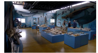
Museum auf Harberton