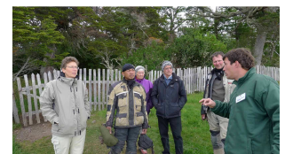
Führung auf Harberton