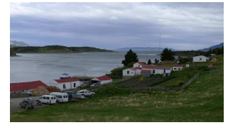
Blick über die Estancia