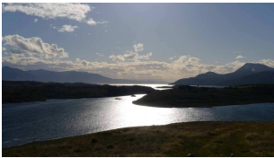
Inseln im Beagle-Kanal