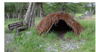
Nachbau einer indianischen Hütte