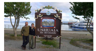
fin del mundo