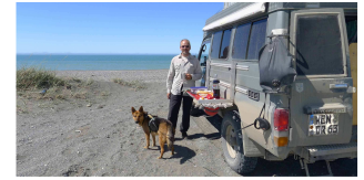
Mittagspause am Atlantik

Es sind nur noch 100 Kilometer bis nach Ushuaia und wir sind gespannt auf die „südlichste Stadt der Welt“. Kurz vor Erreichen der Küste wird das Wetter besser und angenehm warm. Wir haben einen wunderbaren Blick auf Ushuaia und den Beagle-Kanal. So wie Rio Grande das wirtschaftliche Zentrum ist, stellt Ushuaia das touristische Zentrum Feuerlands dar. Fast täglich legt ein Kreuzfahrtschiff hier an und spuckt seine Passagiere aus. In der Einkaufsmeile Avenida San Martin treffen sich dann Reisende aus aller Welt zum gemeinsamen Stadtbummel. Weil es abends noch so lange hell ist, machen wir unseren Schaufensterbummel erst um 23:00 Uhr, wenn die meisten Touristen bereits am kalten Buffet stehen oder wieder in ihren Kojen liegen. Die angebotenen Souvenirs sind die gleichen wie in Bariloche oder El Calafate – nur der Ortsname auf T-Shirts, Tassen und sonstigem Nippes wurde ausgetauscht... Da schadet es nicht, dass bereits alle Geschäfte geschlossen haben,