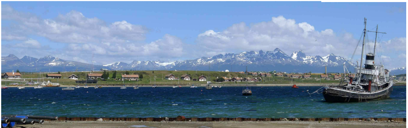
Blick von Ushuaia zum Beagle-Kanal