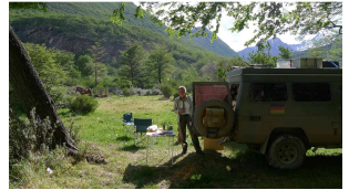
Grillen am Rio Olivia