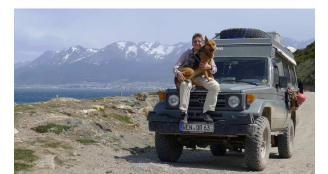
an unserem fin del mundo