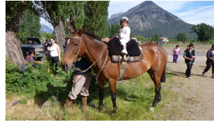
früh übt sich