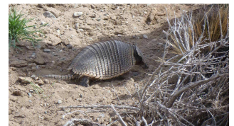
so ein süßer Armadillo