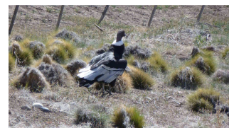
Kondor am Pistenrand