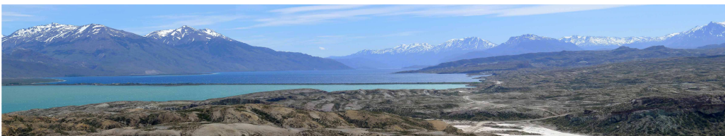
Lago Posadas und Lago Pueyrredon