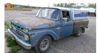
Zusammen 115 Jahre alt