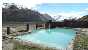
Termas de Sosneado

Bis demnächst! Diana und Rüdiger mit Sally