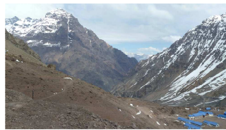
kurz vor dem Tunnel