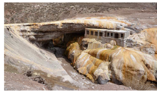
Puente del Inca