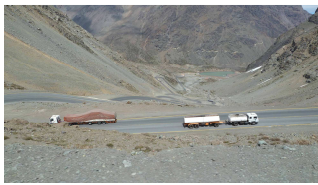
Paso de la Cumbre