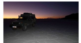
einsame Übernachtung am Salar