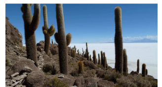
Kakteen auf Incahuasi