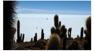
Blick auf den Salar