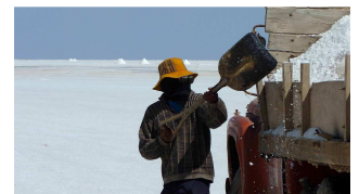
Vermummung gegen Salz und Sonne