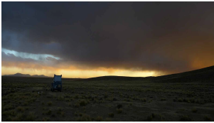
Gewitter vor den Toren Oruro's