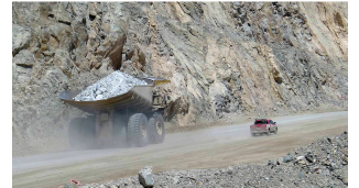
Riesen-LKW (400 t Tragkraft)

Ganz liebe Grüße von Diana, Rüdiger und Sally!