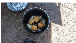
frische Semmeln im DO