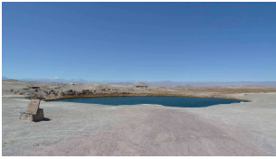
Laguna Inca Coya