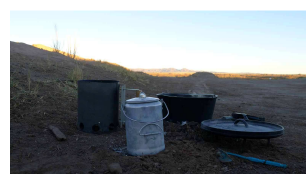
Duch-Oven (DO) und Zubehör