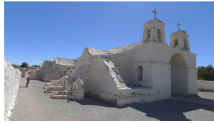
Iglesia de Chiu Chiu