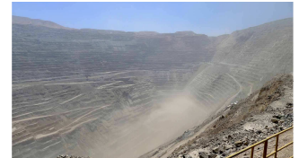
Blick in die Tiefe

Reiseroute: Laguna Inca Coya und Umgebung