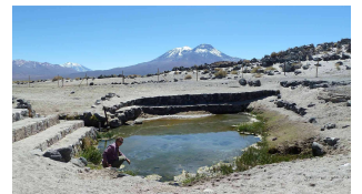
Banos de Turi