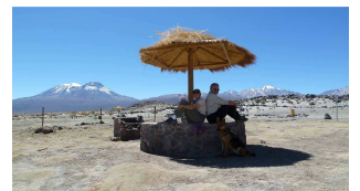
Uns geht's gut!