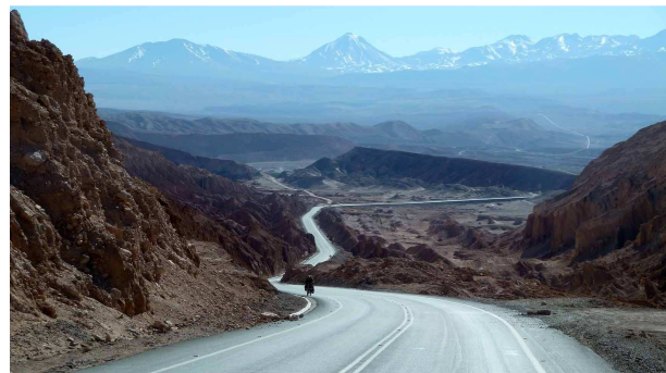
Anfahrt ins Valle de la Muerte