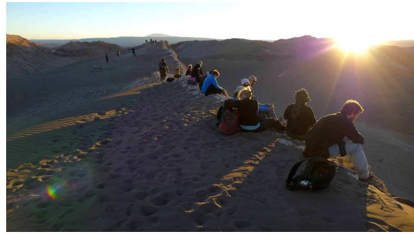
Auch Andere wollen dabei sein.