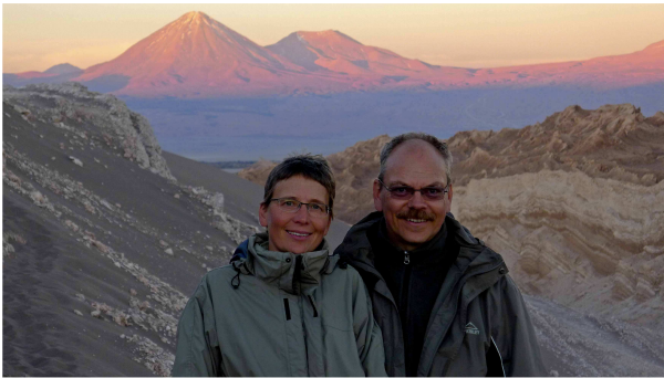
Abendstimmung vor dem Vulkan Licancabur