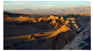
Valle de la Luna

Bis zum nächsten Bericht! Diana und Rüdiger