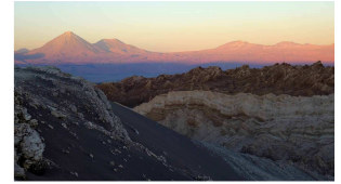
Valle de la Luna