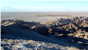
Blick auf Oase San Pedro de Atacama