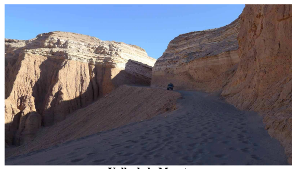
Valle de la Muerte