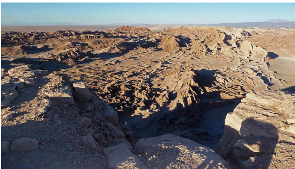
Valle de la Luna bei Sonnenaufgang