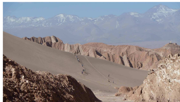
Sandboarder (im Hintergrund einige 6000er)