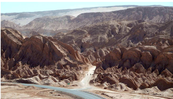
In Echt noch viel beeindruckender...