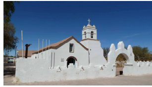
Kathedrale San Pedro