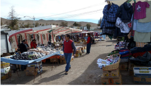
Markt in El Salvador