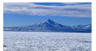
Vulkan hinter Salar