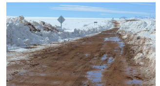
So mögen wir es!?