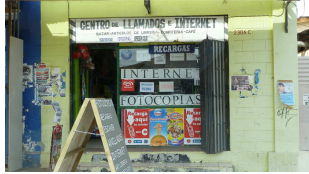
Hier senden wir den Bericht