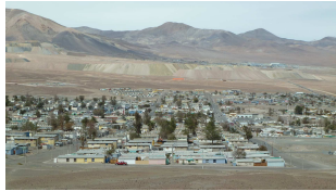
Minenstadt El Salvador