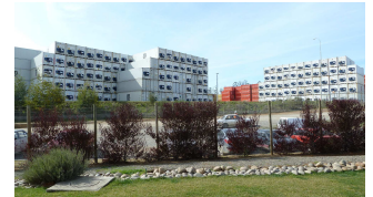
keine Wohn- sondern Containerburgen