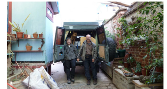
im Hof der Villa Kunterbunt

Die Verschiffung hat inklusive aller Kosten ca. 2.900,00 EUR gekostet.