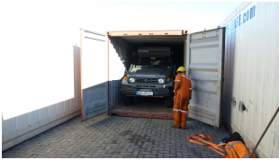
Bienvenido en Chile